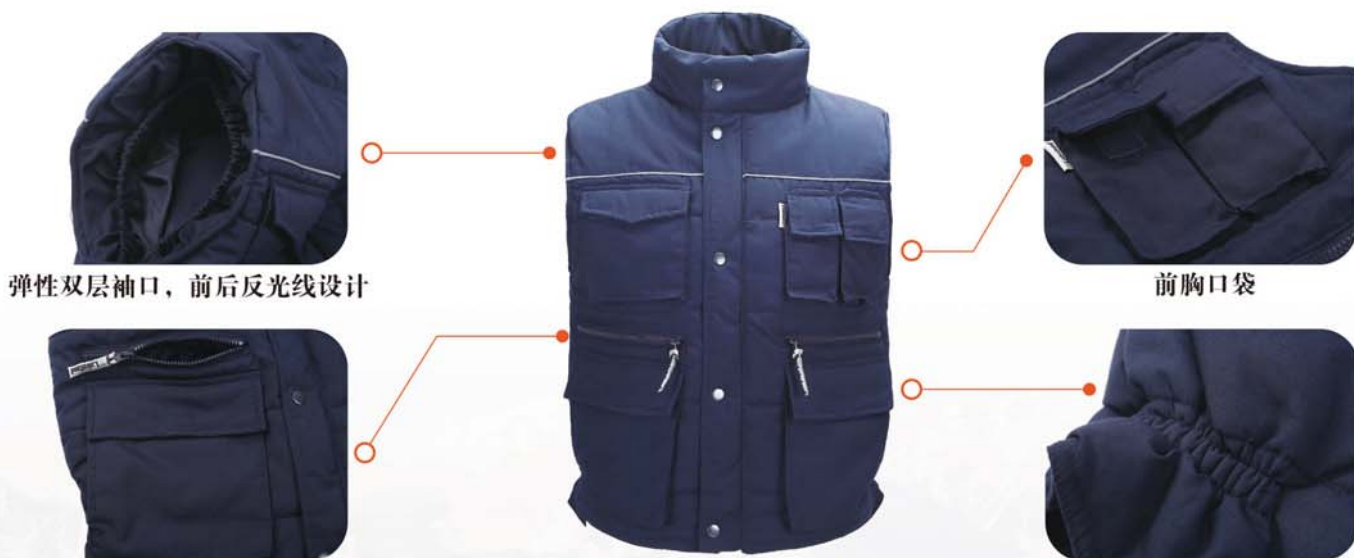
弹性双层袖口，前后反光条设计