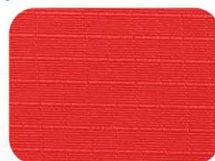
涤纶和TPU膜复合面料