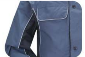
口袋、手臂反光设计