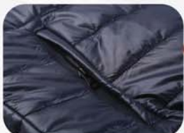
两个保暖侧插口袋