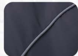
前胸、后背、手臂反光设计