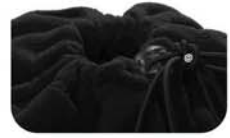
收缩绳设计，调节自如