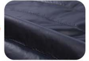
锦纶面料，防泼水处理