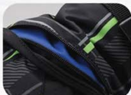
手背带拉链的小口袋