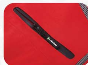
前胸防水拉链口袋