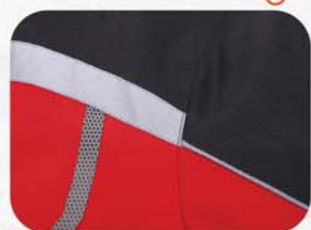
前胸、后背、手臂、插兜反光设计