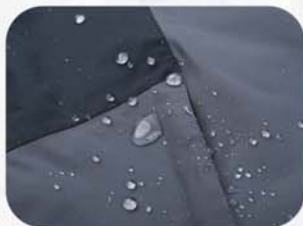
面料经防水处理，防水接缝