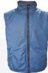
内胆为9010防寒马甲，可单穿