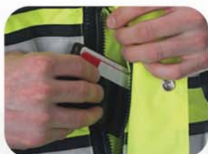
8英寸深多功能侧插口袋，防风防雨拉链闭合