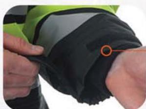
袖口有可调节魔术搭扣和松紧带