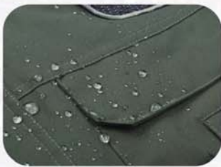
面料经防水处理，防水接缝