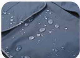
面料经防水处理，防水接缝