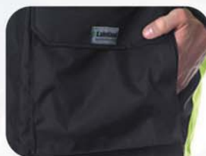
2个腹部侧插暖手口袋