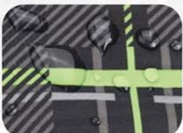
进口面料防水透气