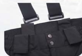
腰部松紧+腰带扣+弹性背带