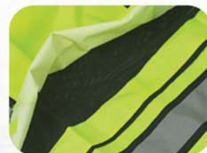
背后开放式透气网眼布设计，防风防雨面料覆盖，魔术搭扣闭合