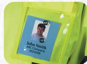
整体式名片和证件袋，上口有魔术贴闭合