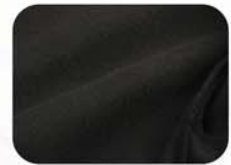
柔软的面料，爱不释手