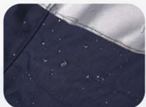
面料经防水处理，防水接缝