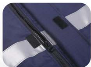
防风防雨门襟，有粘扣闭合