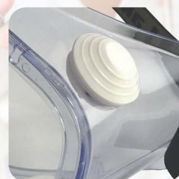
4组间接通风孔设计