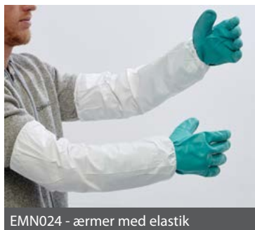
EMN024 - ærmer med elastik