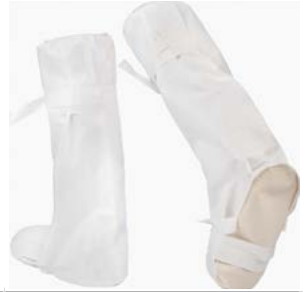
EMN023NS - støvleovertræk med skridsikker sål