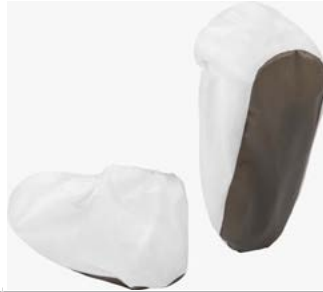
EMN022ANS - Skoovertræk med skridsikker og antistatisk sål