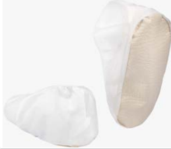
EMN022NS - skoovertræk med skridsikker sål