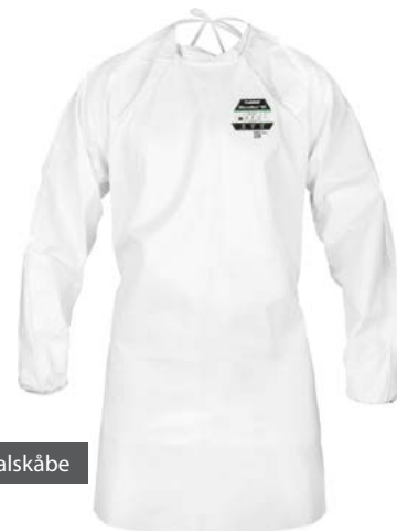
EMN527 - hospitalskåbe