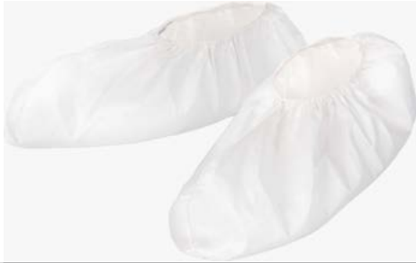
EMN022 - skoovertræk, ingen sål

Et udvalg af MicroMax® NS skoovertræk og støvler til beskyttelse af den der bærer dem samt af miljøet.