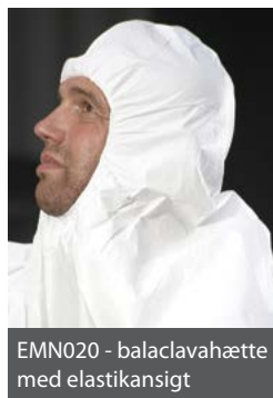
EMN020 - balaclavahætte med elastikansigt