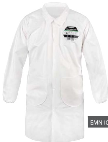
EMN101 - laboratoriekittel

Et udvalg af MicroMax® NS-tilbehør for fleksibel og komfortabel beskyttelse til forskellige formål