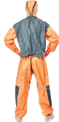
MicroMax® NS Cool Suit