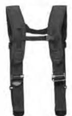
20. 型号 135R